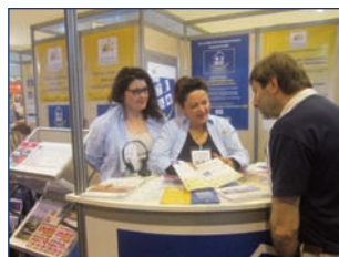
Photos : de haut en bas : Tourissima (Lille), Mahana (Lyon) Mahana (Toulouse) Salon Mondial du Tourisme (Paris)