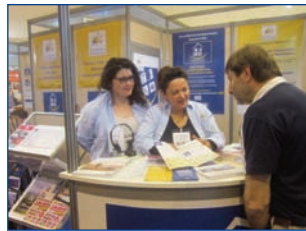
Photos : de haut en bas : Tourissima (Lille), Mahana (Lyon) Mahana (Toulouse) Salon Mondial du Tourisme (Paris)