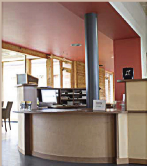
Accueil à hauteur