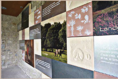
Entrée, mosaïque de matières